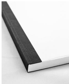
Abbildung 1: Buchformat, Klebebindung links.

Die Bindung erfolgt links mittels Klebebindung (siehe Abbildung 1).