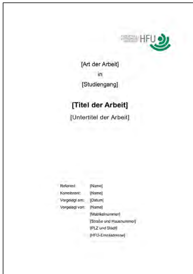
Abbildung 4: Titelblatt.

Die Formatierung des Titelblattes muss der Vorlage (siehe Abbildung 4) entsprechen.